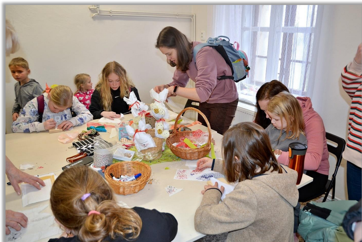
Velikonoční tvoření ve společenských prostorách muzea v dubnu 2023

Výtvarné dílny jsou také součástí každé krátkodobé výstavy, tyto připravují zaměstnanci muzea a jsou v rámci vstupného k dispozici všem návštěvníkům výstav po celou dobu konání.