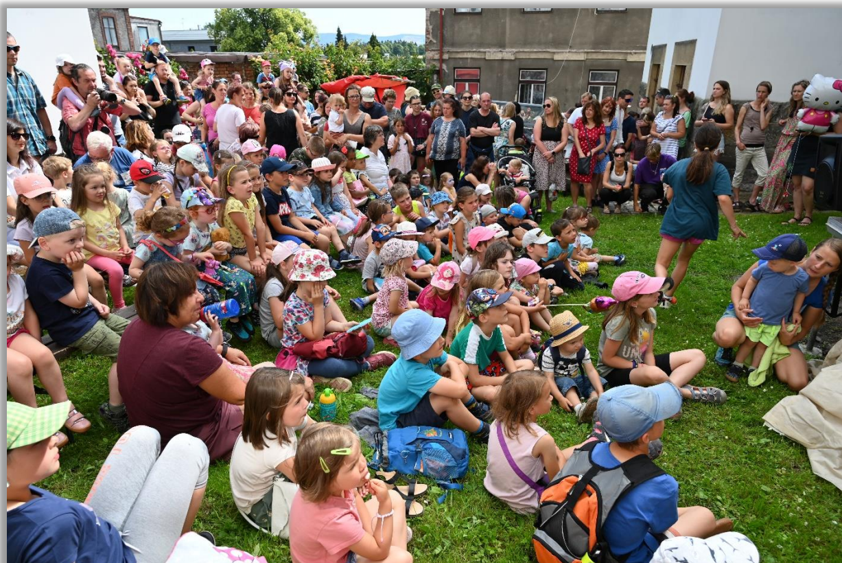
Návštěvníci loutkohereckého představení na dětské scéně ve dvorku muzea při Dni lidových řemesel dne 5. července 2023

Dvorek budovy čp. 10 pravidelně ožívá při letních výtvarných dílnách, u příležitosti Muzejních nocí, Dne lidových řemesel a Dni evropského dědictví.