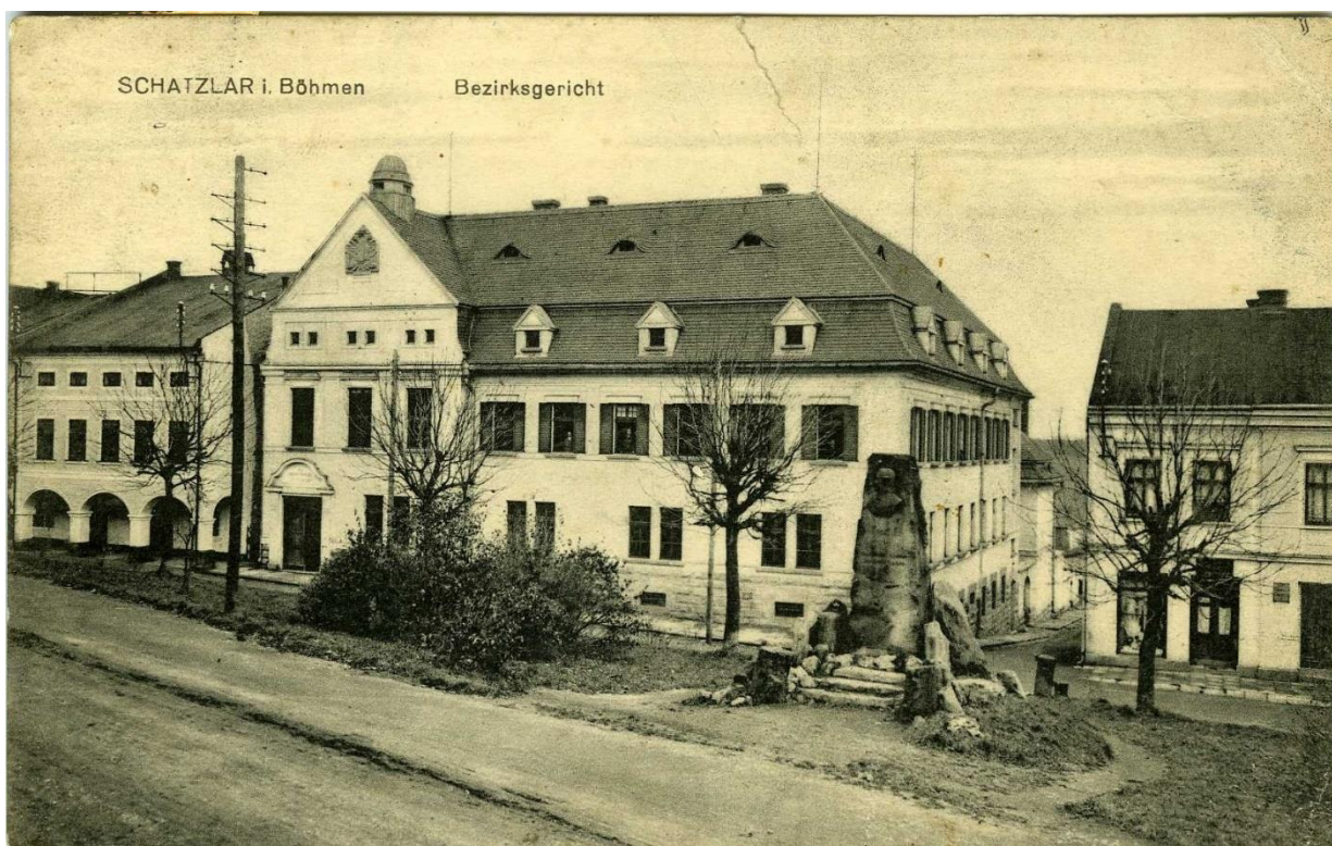
Historická pohlednice zachycující budovu současného sídla muzea čp. 10 z počátku 20. st., tehdy byl objekt sídlem okresního soudu a jeho zaměstnance můžeme spatřit v oknech 2. podlaží