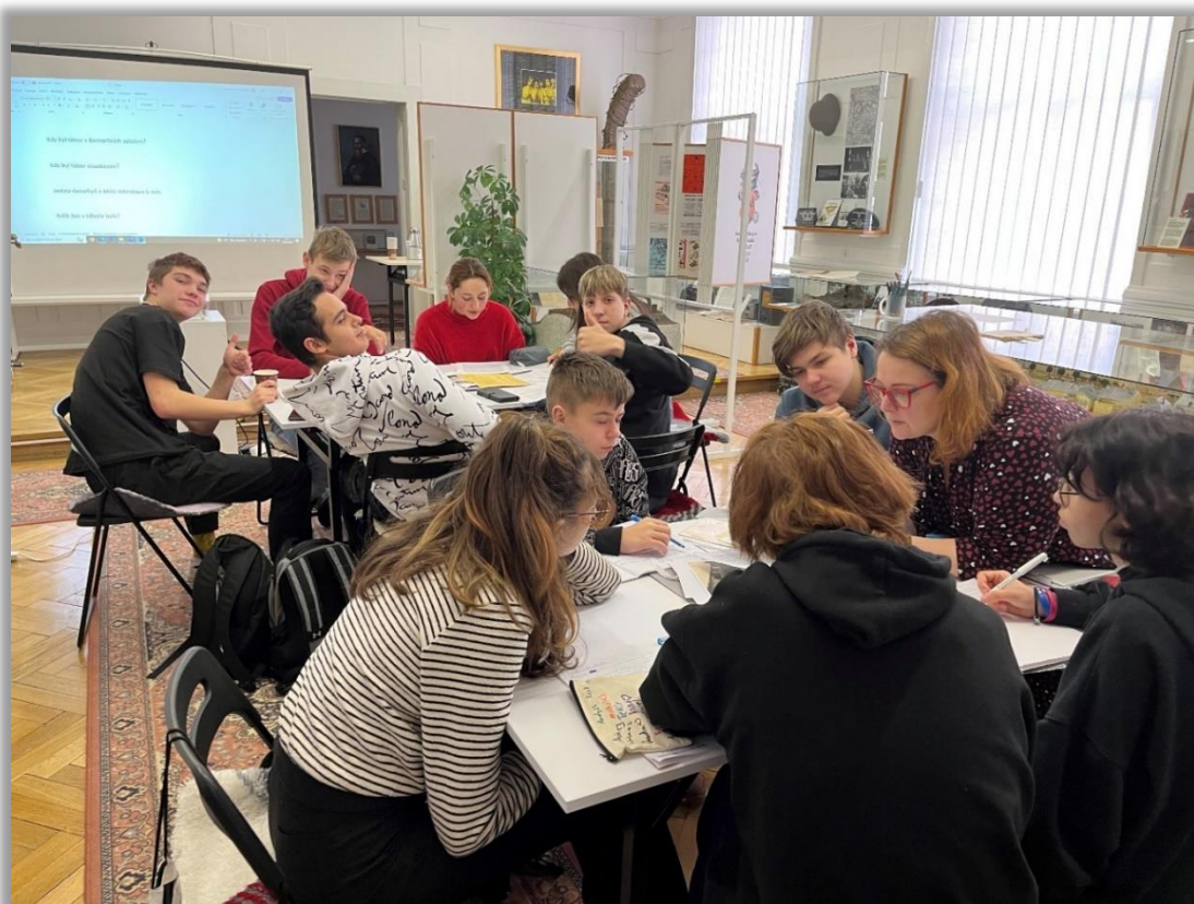
Fotografie z edukačního programu pro ZŠ Bernartice 19. 1. 2023 na téma životní podmínky v židovském táboře nucených prací v Bernarticích za II. světové války

Městské muzeum Žacléř vytváří edukační programy na přání po osobní, telefonické či korespondenční domluvě pro všechny věkové kategorie.