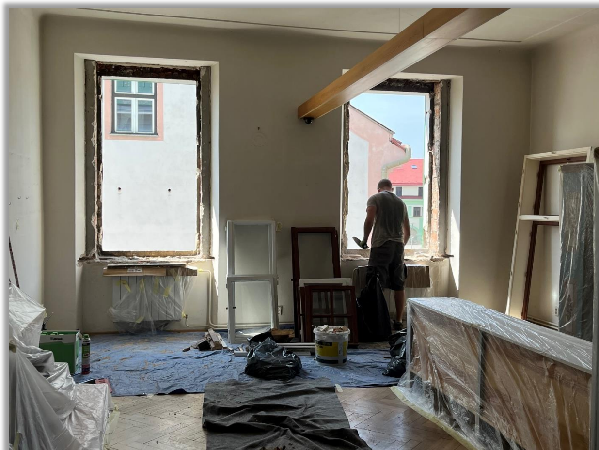
V červnu 2023 proběhla náročná výměna částí oken v prvním patře a přízemí budovy muzea

V době od 19. června do 2. července 2023 bylo přistoupeno k další fázi výměny oken v budově muzea. Práce se dotkly společenských prostor přístupných z ulice Sadová a druhého podlaží zahrnující nejen zázemí, ale také stálou národopisnou expozici. Nová špaletová okna ve stálé expozici byla opatřena ochrannou solární UV folií. Výměna si vyžádala logisticky složité stěhování exponátů, důkladné zakrývání nedemontovatelných částí a následný úklid, tyto práce prováděli zaměstnanci muzea ve vlastní režii. Celkem bylo vyměněno 16 oken. Výměna mohla být uskutečněna díky dotaci Ministerstva kultury ČR z programu Regenerace městských památkových zón. Pro rok 2024 je naplánována další fáze výměny oken ve zbylých částech stálé expozice.