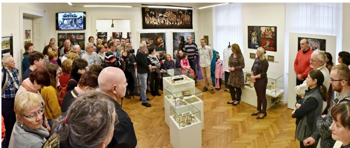
První výstava roku 2020 nás přenesla do pestrobarevné Indie, slavnostní zahájení s ochutnávkou indických pokrmů a čaje masala proběhla 25. ledna

Muzeum disponuje 2 výstavními místnostmi, které jsou vyhrazeny pravidelným krátkodobým výstavám. V roce 2020 byly uspořádány celkem 3 mimořádné výstavy. Další výstava našla své místo ve společenských prostorách muzea v přízemí, které je přístupné z ulice Sadová.