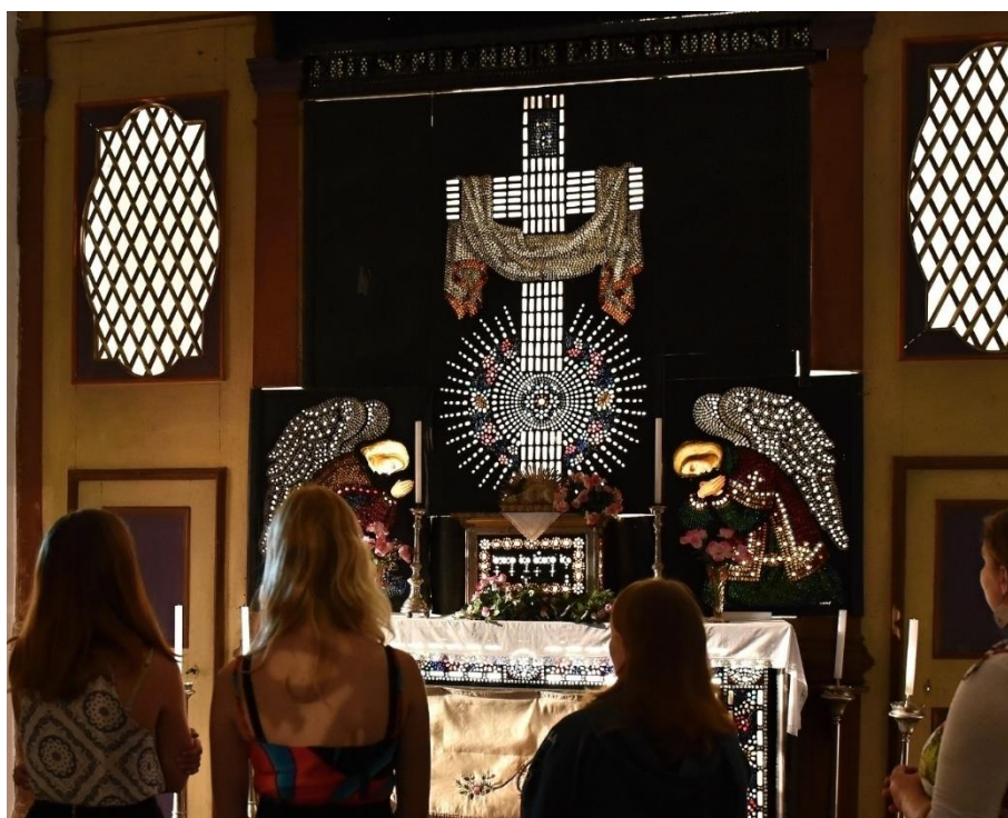
Podsvícený skleněný oltář v loretánské kapli kostela Nejsvětější Trojice v Žacléři z přelomu 19. a 20. st.

V roce 2020 Městské muzeum Žacléř navázalo spolupráci s Historickým ústavem Akademie věd ČR a spolupracuje na realizaci projektu „Prameny Krkonoš Vývoj systému evidence, zpracování a prezentace pramenů k historii a kultuře Krkonoš a jeho využití ve výzkumu a edukaci“ , který je realizován realizuje v rámci Programu aplikovaného výzkumu a vývoje národní a kulturní identity (NAKI II) Ministerstva kultury České republiky. Nedílnou a jednou ze stěžejních součástí muzejní činnosti je výzkumná činnost týkající se historie Žacléře a blízkého regionu. Zaměstnanci muzea se věnovali v roce 2020 podrobně níže uvedeným tématům.