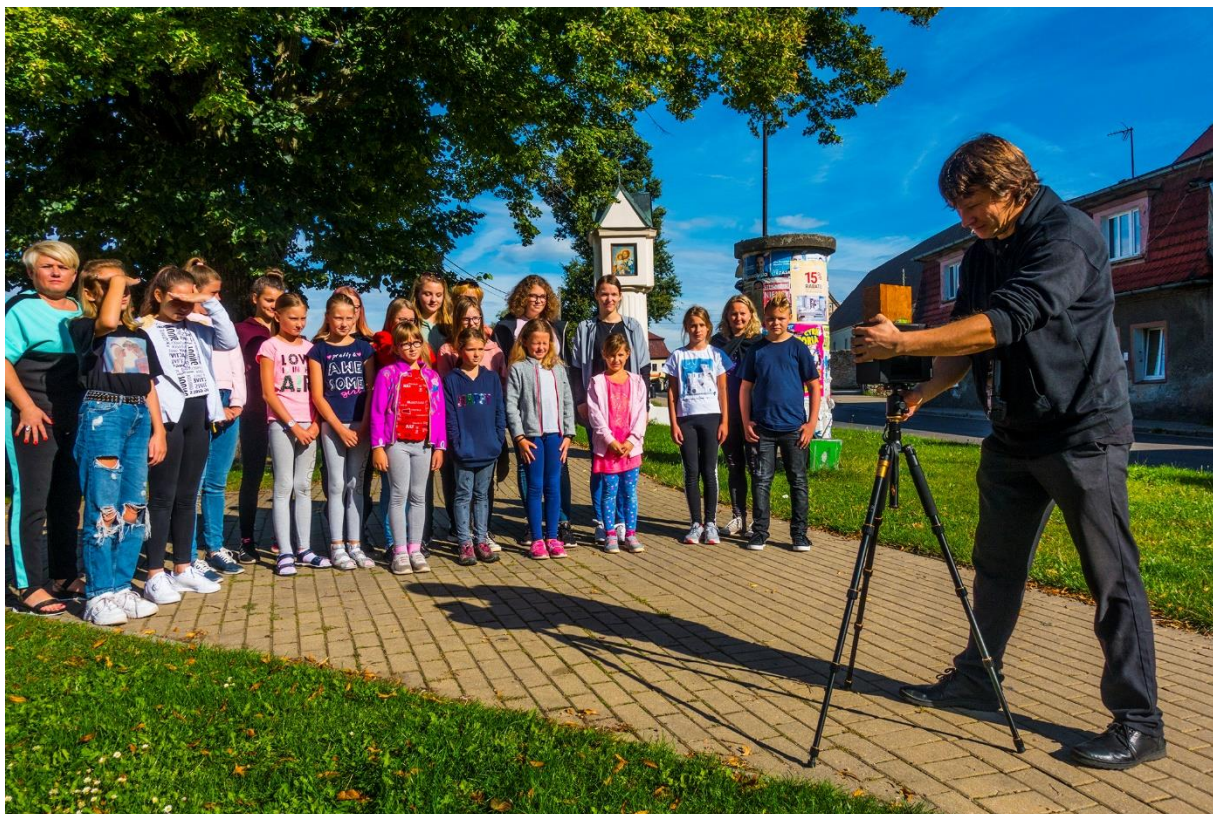
Účastníci fotoworkshopu – pinhole camera v polského Křešově v areálu barokního klášterního komplexu dne 5. 9. 2020