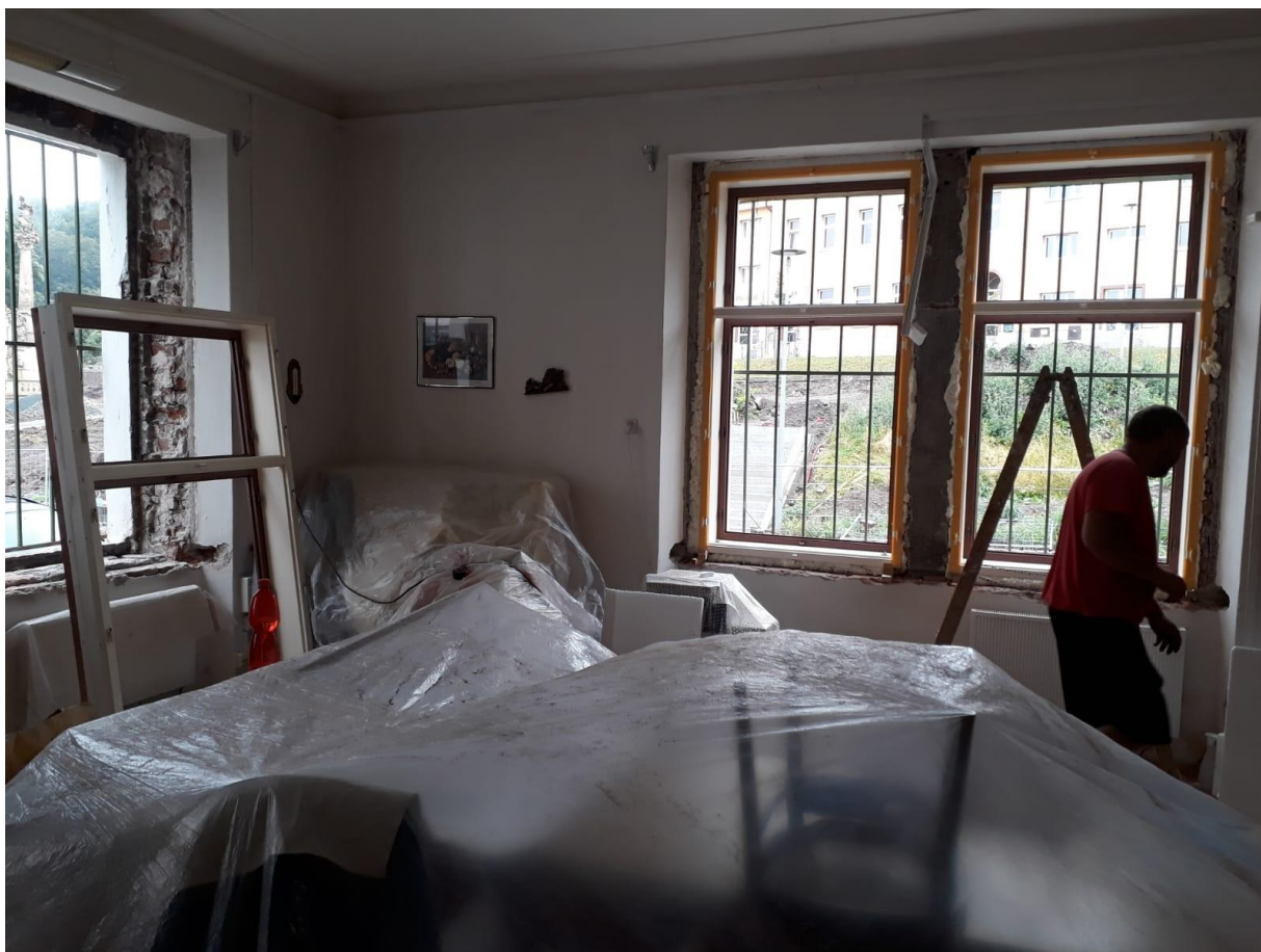
Výměna částí oken v budově čp. 10 – pošty/muzea v podzimních měsících 2020

Rok 2020 byl pro celý svět i kulturní instituce nesmírně složitým obdobím s dosud nevídanými opatřeními a nejistotami. Mohly však být snáze provedeny úpravy na budově a v interiéru. Období nouzového stavu, přelom dubna a května, bylo využito k vymalování sklepního schodiště v suterénu , které propojuje vstupní chodbu budovy s dvorkem. Spojovací schodiště je využíváno především v letních měsících a při akcích v podobě vernisáží v Galerii Pošta, Dni lidových řemesel, muzejní noci. Nově tento rok také posloužilo návštěvníkům k průchodu do odpočinkové zóny, kde měli připravená skládací dřevěná lehátka. Mnoho desetiletí stará a poškozená výmalba byla nahrazena novou.