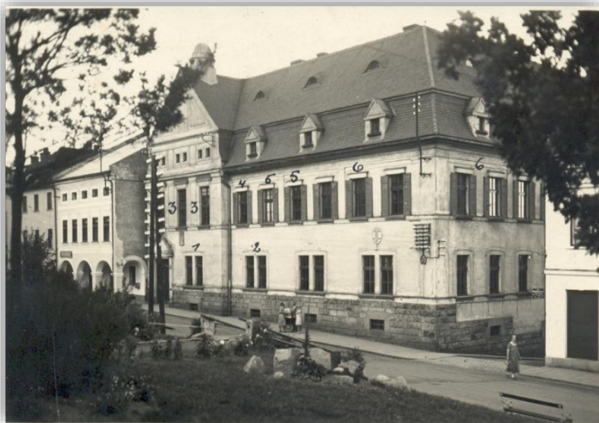
Budova okresního soudu 1. pol. 20. st.