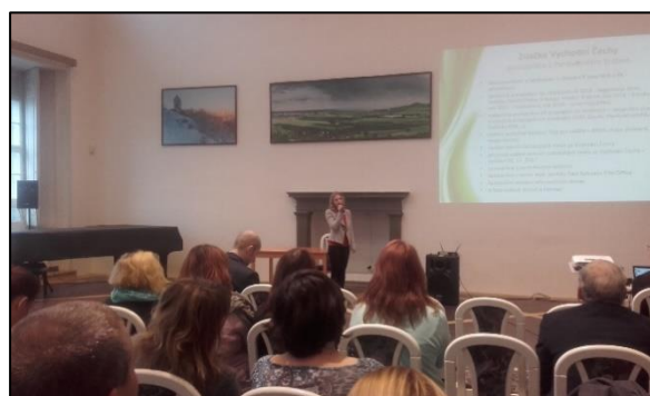
Konference TIC v Jičíně 2017

Filmová turistika a s ní související propagace ve spolupráci se Svazkem měst a obcí Krkonoš: