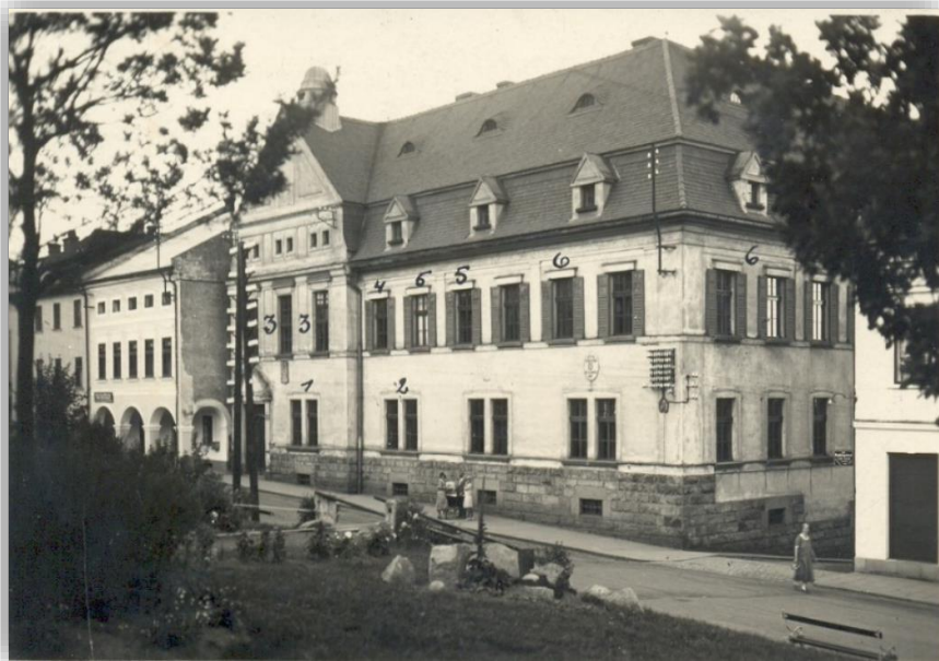
Budova okresního soudu 1. pol. 20. st.