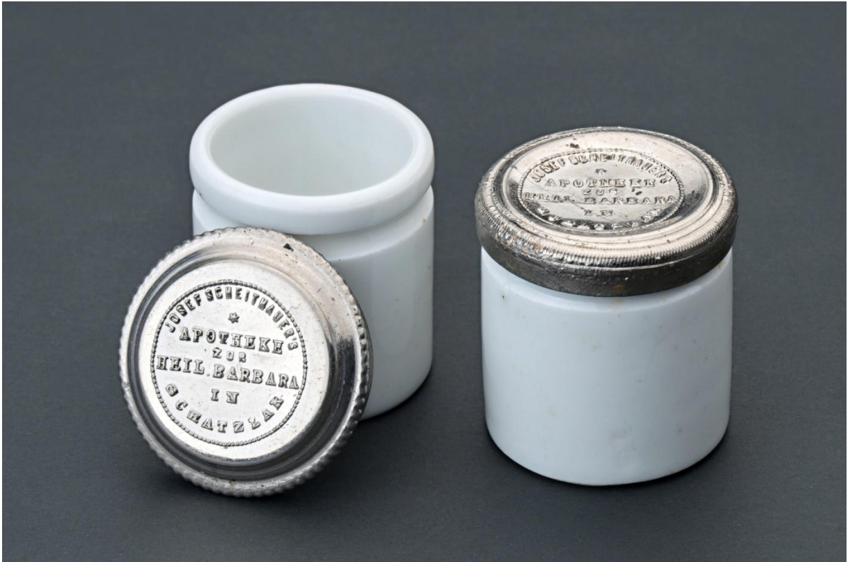
Přírůstek do sbírky v podobě porcelánových lékárenských dóz s firemním víčkem žacléřské lékárny U Sv. Barbory

Sbírkové předměty získává muzeum především formou darů, nebo vlastní sbírkotvornou činností. K 31. 12. 2024 muzeum eviduje 2142 sbírkové předměty.