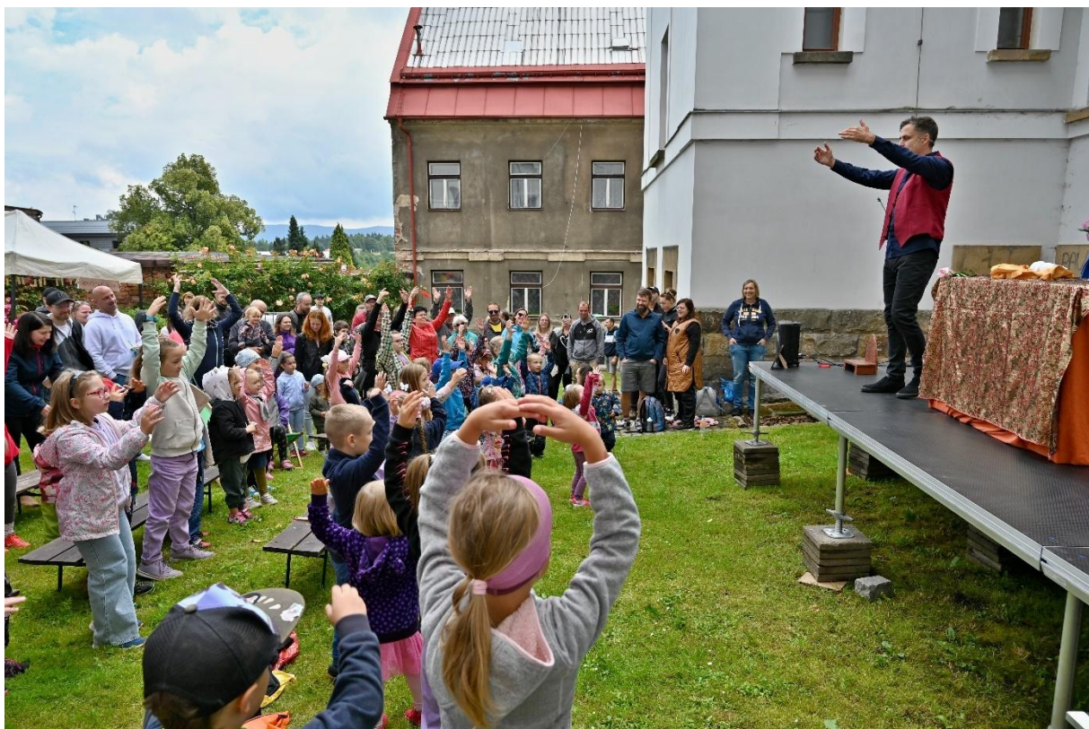
Návštěvníci loutkohereckého představení na dětské scéně ve dvorku muzea při Dni lidových řemesel dne 5. července 2024

Muzejní dvorek je v průběhu roku zpřístupňován u příležitosti různých kulturních akcí. O jeho údržbu se starají zaměstnanci muzea a Technické služby Žacléř. V minulosti byly u cihlové zdi vysazeny pnoucí růže, které každoročně kvetou bohatými květy, staré popeliště bylo proměněno v bylinkovou zahrádku. V letošním roce bylo odstraněno staré poškozené pódium a při představení při Dni lidových řemesel mělo premiéru městem Žacléř nově pořízené přenosné pódium, které poslouží i dalším městským akcím.