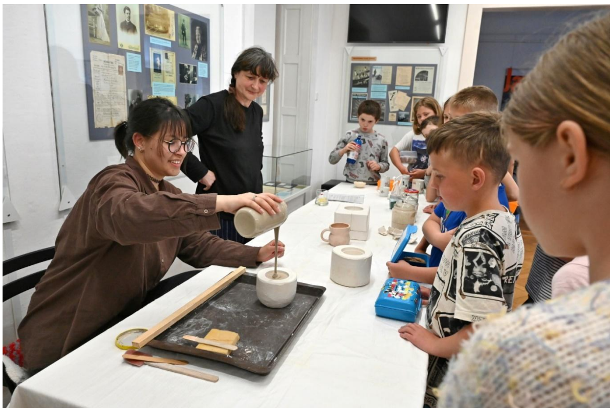
Edukační program na téma průmyslové obory v žacléřské historii s ukázkou odlévání porcelánu, připravený pro 4. třídu místní ZŠ dne 24. 5. 2024

Městské muzeum Žacléř vytváří edukační programy na přání po osobní, telefonické či korespondenční domluvě pro všechny věkové kategorie.