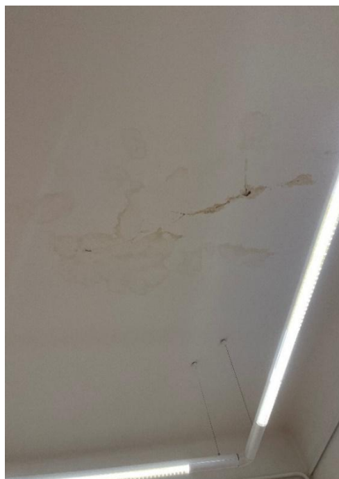
Výmalba stropu po průsaku vody v první výstavní místnosti v dubnu 2024

Díky dotačním prostředkům na podporu muzeí Královéhradeckého kraje byly pořízeny archivační skříně umístěné ve dvou podlažích zázemí muzea.