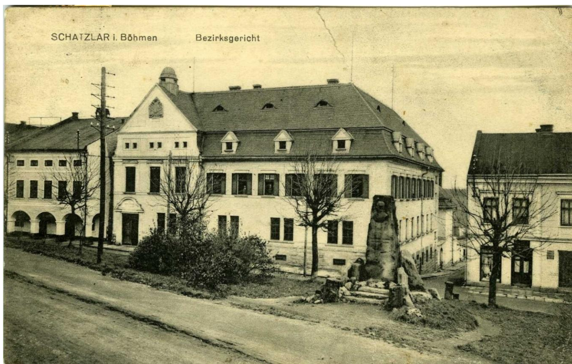
Historická pohlednice zachycující budovu současného sídla muzea čp. 10 z počátku 20. st., tehdy byl objekt sídlem okresního soudu