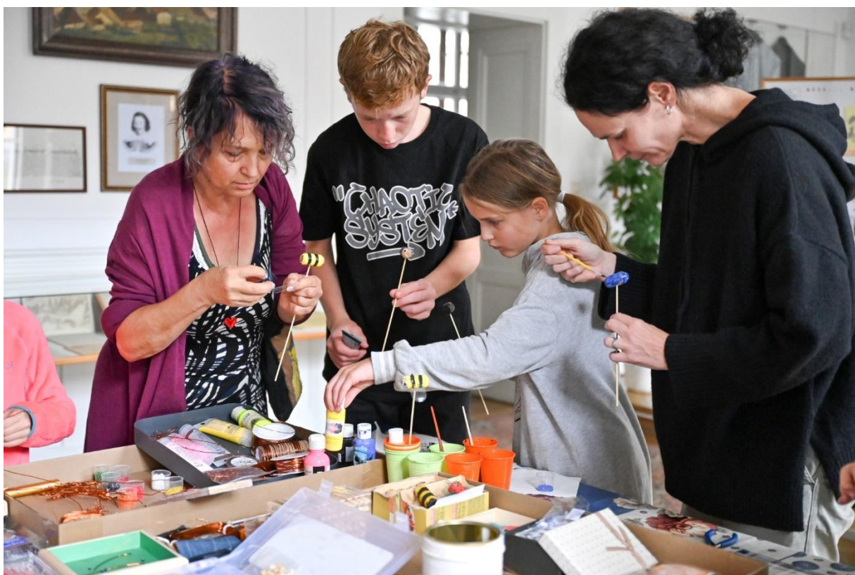
Tvoření při příležitosti Dne evropského dědictví v září 2024

Výtvarné dílny jsou také součástí každé krátkodobé výstavy, tyto připravují zaměstnanci muzea a jsou v rámci vstupného k dispozici všem návštěvníkům výstav po celou dobu konání.