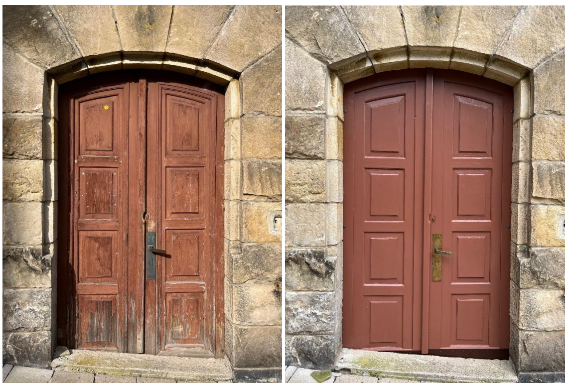
V letošním roce se podařilo zrenovovat boční vstupní dveře, na snímcích zachyceny před renovací a po provedených pracích